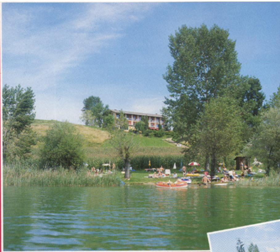
Eigener Badestrand für Hausgäste.