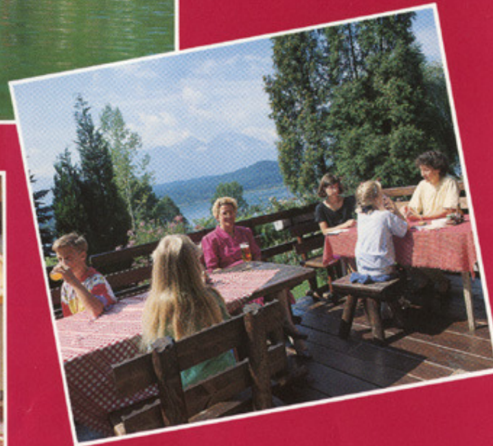
Vorzügliche Küche mit Kärntner Spezialitäten. Hausschlachtung, biologischer Gemüseanbau. Mehlspeisköstlichkeiten! Reichhaltiges Frühstück, Halbpension.

Urlaub, so wie man ihn sich erträumt ... mitten im Grünen und direkt am See! Kärntner Gastlichkeit, Gemütlichkeit und familiäre Atmosphäre zeichnen unser ruhig gelegenes 60-Betten-Hotel aus. Geöffnet Ostern bis Ende September.